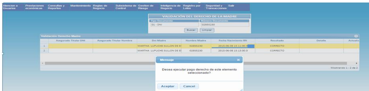
Pantalla de registro del subsidio por lactancia